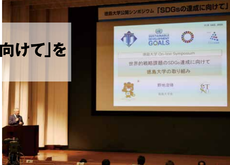
SDGsと徳島大学の取り組みを紹介する野地学長