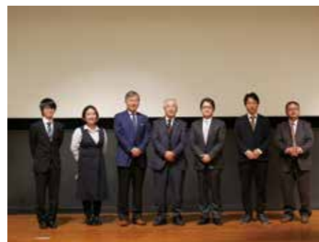
長井記念ホールの登壇者